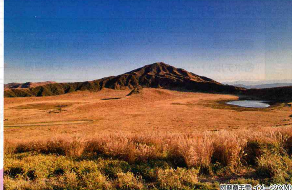
阿蘇草千里 イメージ(XM)