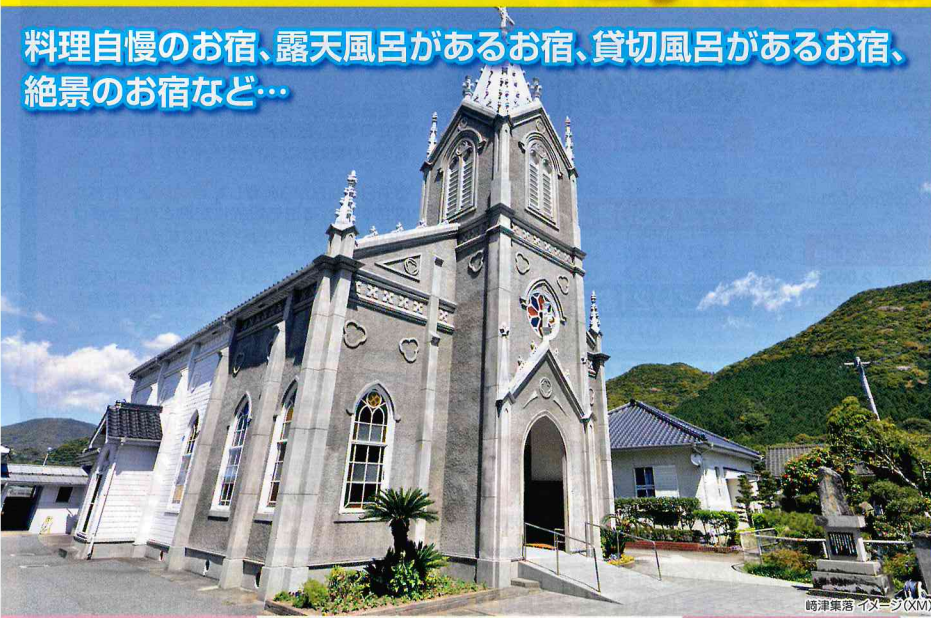
崎津薬師 イメージ(XM)