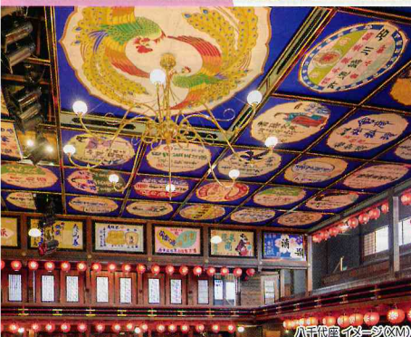
八千代園 イメージ(XM)