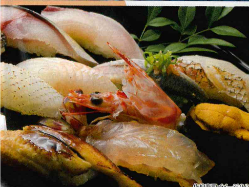
佐伯海鮮イメーグ(H)