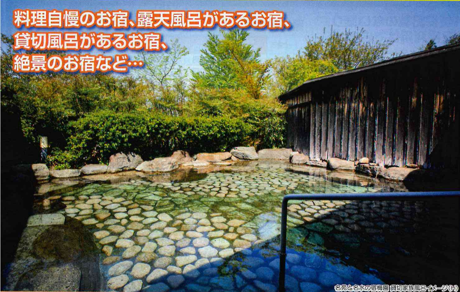
色気と名水の宿 亀の井 別府 亀の井ホテル (H)