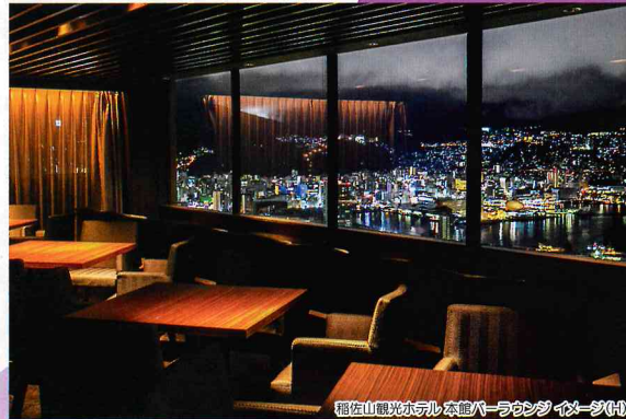
稲佐山観光ホテル本館バーラウンジ イメーグ(XM)