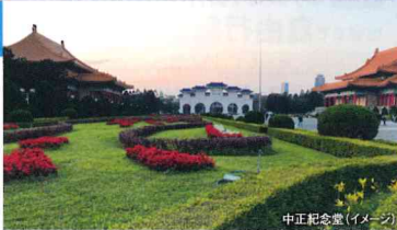
中正記念堂(イメージ)

格調高い台北のランドマーク 衛兵交代も必見の定番スポット 清廉かつ広大さを象徴する白い大理石と青い 瑠璃瓦を主体にした建物の周りにはベニ花が 植えられており、中正紀念堂は格調高い台北 のランドマークです。