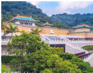
故宮博物院(イメージ)

所蔵品の多くは北京の故宮歴代皇帝が 集めたものですが、国共内戦時の戦火を 避けて中国大陸を大移動し台湾に移送さ れました。白と緑の翡翠で白菜を彫り込ん だ「翠玉白菜」は人気です。