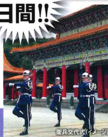
衛兵交代式(イメージ)